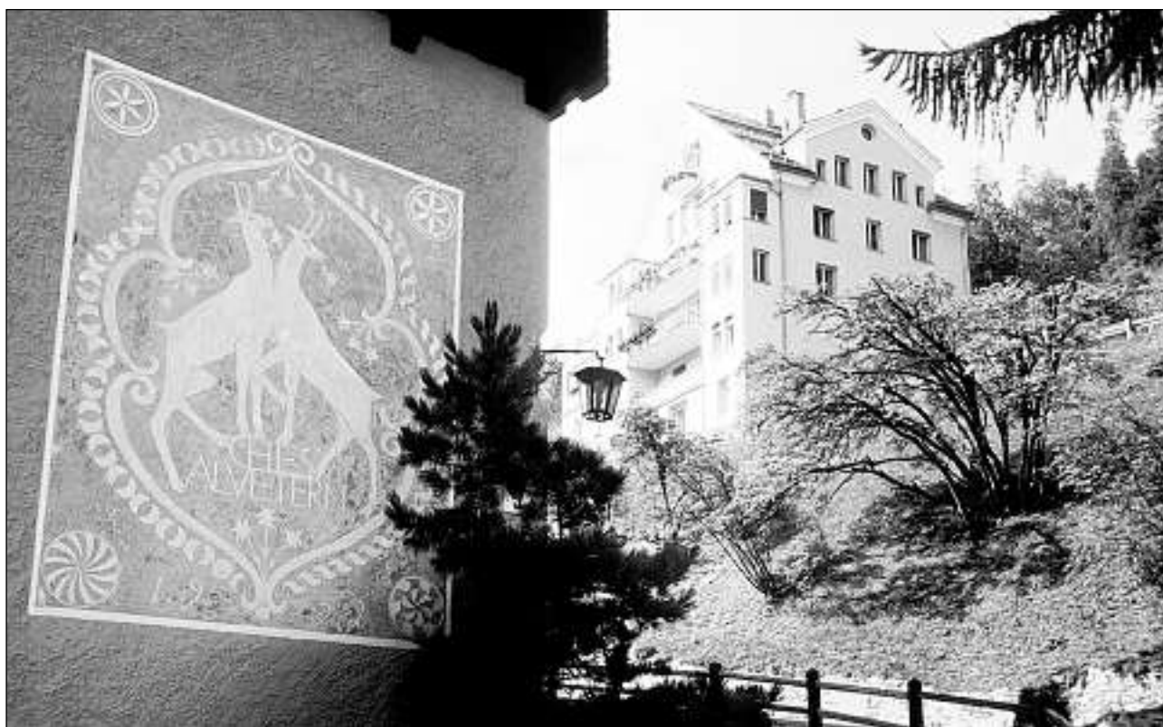
Vista da l'anteriura villa Bernhard (nua ch'in sgrafit zuppenta l'entrada dals pazients) vers la clinica Bernhard da quel temp.