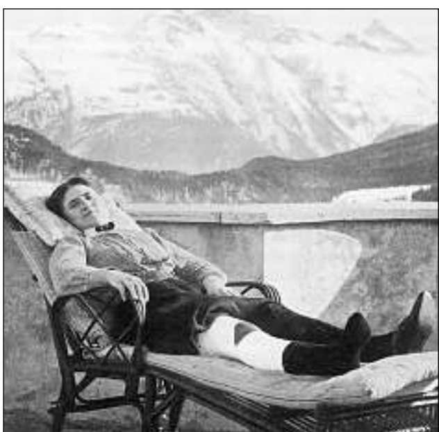
La metoda tempriva dal tractament cun radis da sulegl tar pazients cun tuberculosa da l'ossa: Irradiaziun solara locala tras ina faschadira da gip cun fanestrigl.